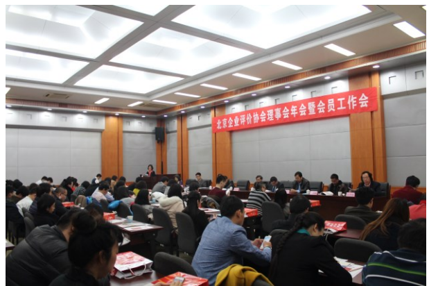
2015 年度理事会年会暨会员工作会现场