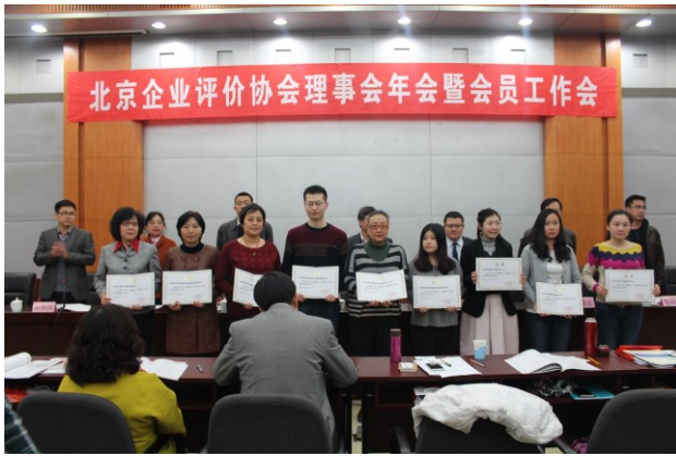
向获奖单位颁发证书