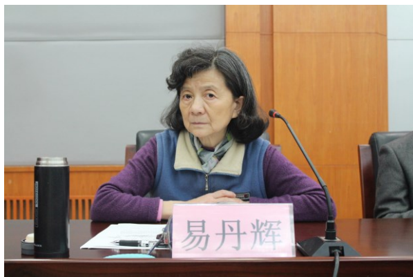
易丹辉副理事长主持会议